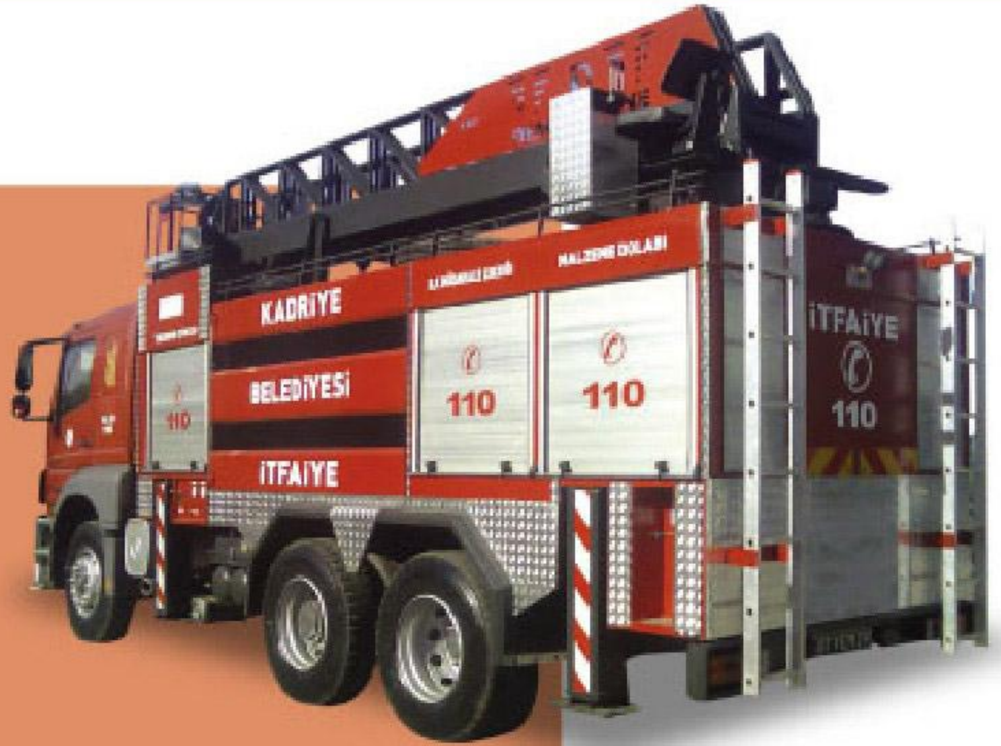
18 METRE HİDROLİK MERDİVENLİ İTFAİYE ARACI

12 metreden 32 metreye kadar, tam otomatik, hidrolik merdivenli, sonsuz dönüşlü, sepete kadar su götürme sistemli, otomatik sepet dengelemeli, kapasiteye göre istinat denge ayaklı, 6 tondan 10 tona kadar su, 200 lt'den 500 lt'ye kadar köpük tanklı ve modüler sistem karasörlü, alüminyum panjur sistemli tam donanımlı itfaiye araçları.