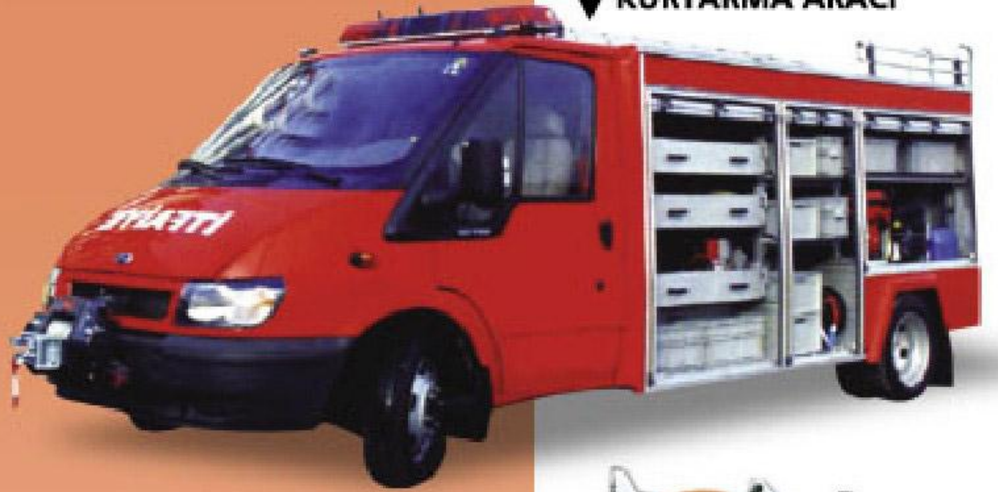
ARAMA KURTARMA ARACI

Kurtarma araçları itfaiyelerimizde öncü araç olarak kullanılabilen ve gerek su tanklı, gerekse yalnızca kurtarma ekipmanları ve yedek malzemeleri taşıyıcı ekipman olarak imal edilmektedir. İç dizayn müşterinin isteğine göre düzenlenmektedir. Araçlarda kullanılan karasör panjurları alüminyum tamburlu tip olup kabin üzeri eskort anons sistemli tepe lambası ile donatılmıştır. Ekipmanlarımız modüler sistem olarak üretilmektedir.