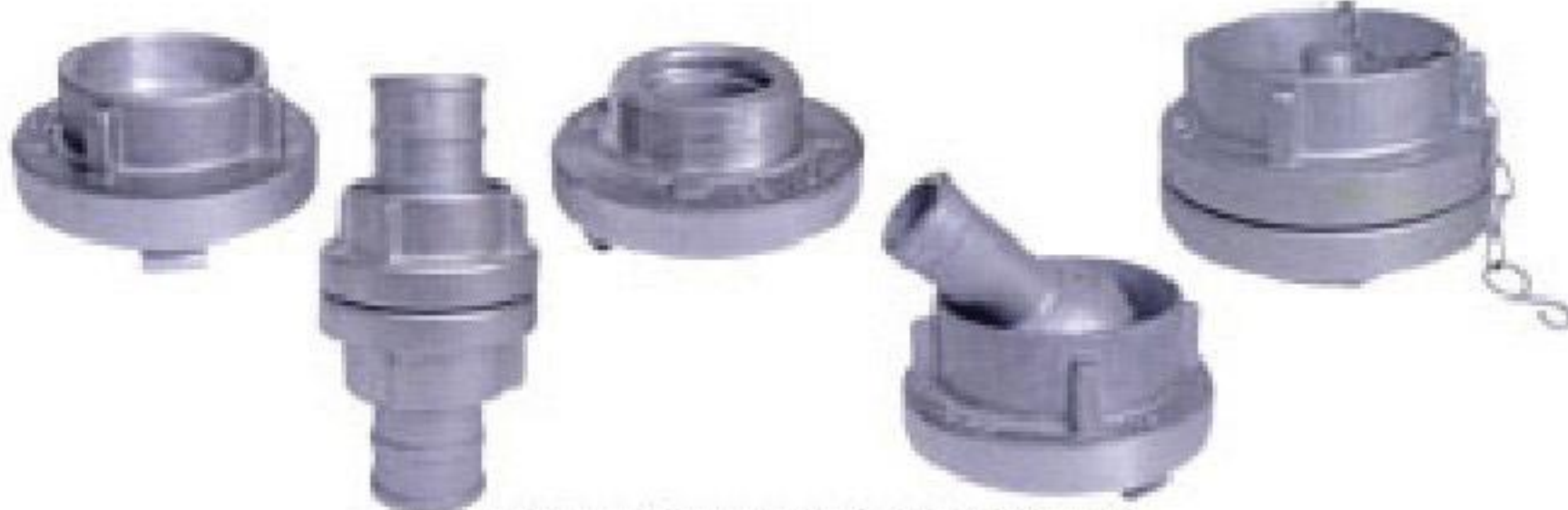
HORTUM REKORLARI 2",2.5"