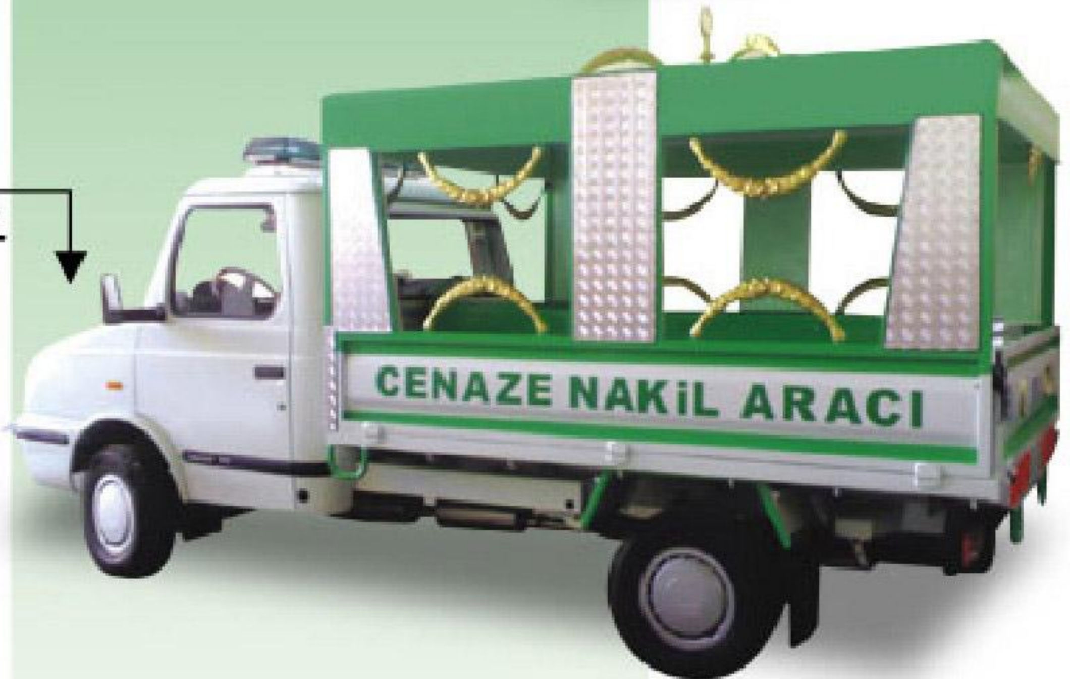
CENAZE NAKİL ARACI

Cenaze araçları ebatlarının boyu 4.10, eni 2.10, yüksekliği 2 metre olarak üretilmektedir. İsteğe bağlı farklı ebatlarda imalat yapılması mümkündür. Bu ekipmanlarda temiz ve atık su tankları mevcut olup havalandırma sistemi, portatif kefenleme ve malzeme dolabı, lavabo, elektrik sistemi monte edilmektedir.