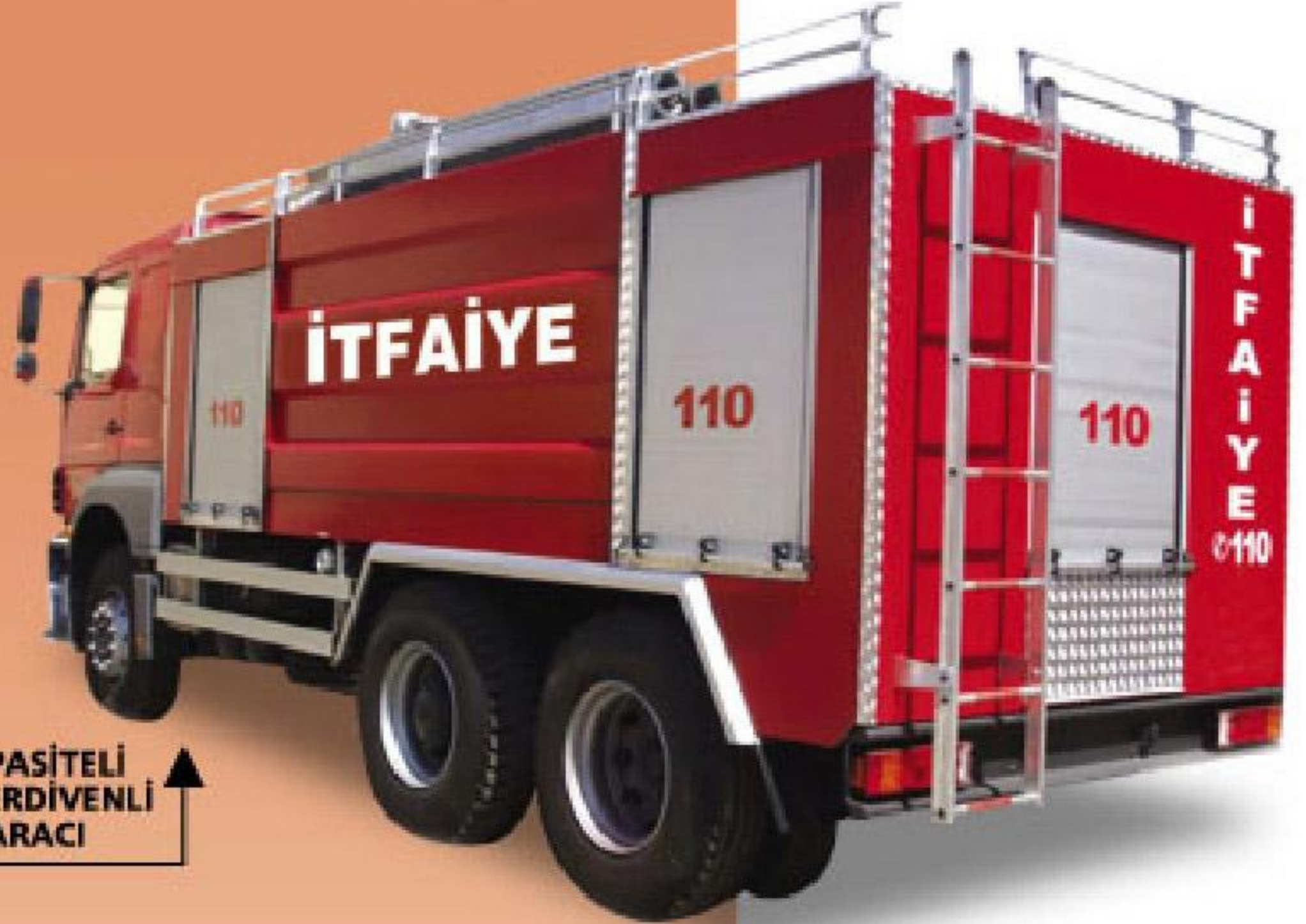
10 TON KAPASİTELİ PORTATİF MERDİVENLİ İTFAİYE ARACI

9 metre portatif alüminyum merdivenli 6 tondan 10 tona kadar su tankı 200 lt'den, 500 lt'ye kadar köpük tankı kapasiteli rediktörlü tip santrafuj pompalı, 4 adet yangın çıkışı, 1 adet monitör, pnomatik ön sulama sistemleri modüler tip karasör ve karasöre bağlı olarak alüminyum panjurlu tam teşekküllü standart tip itfaiye araçları.