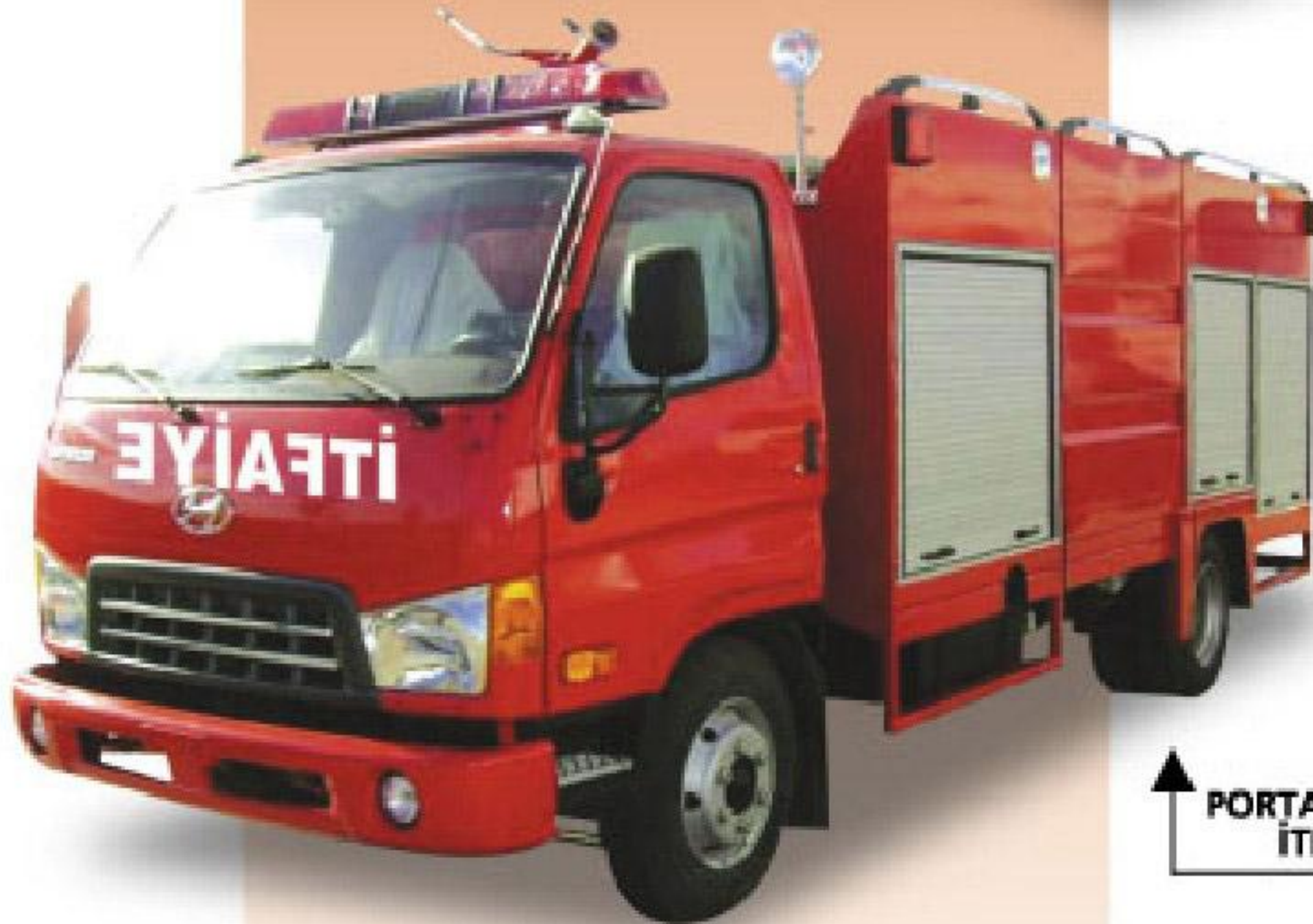
9 METRE PORTATİF MERDİVENLİ İTFAİYE ARACI