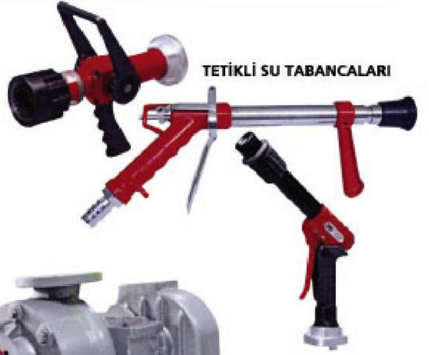
TETİKLİ SU TABANÇALARI