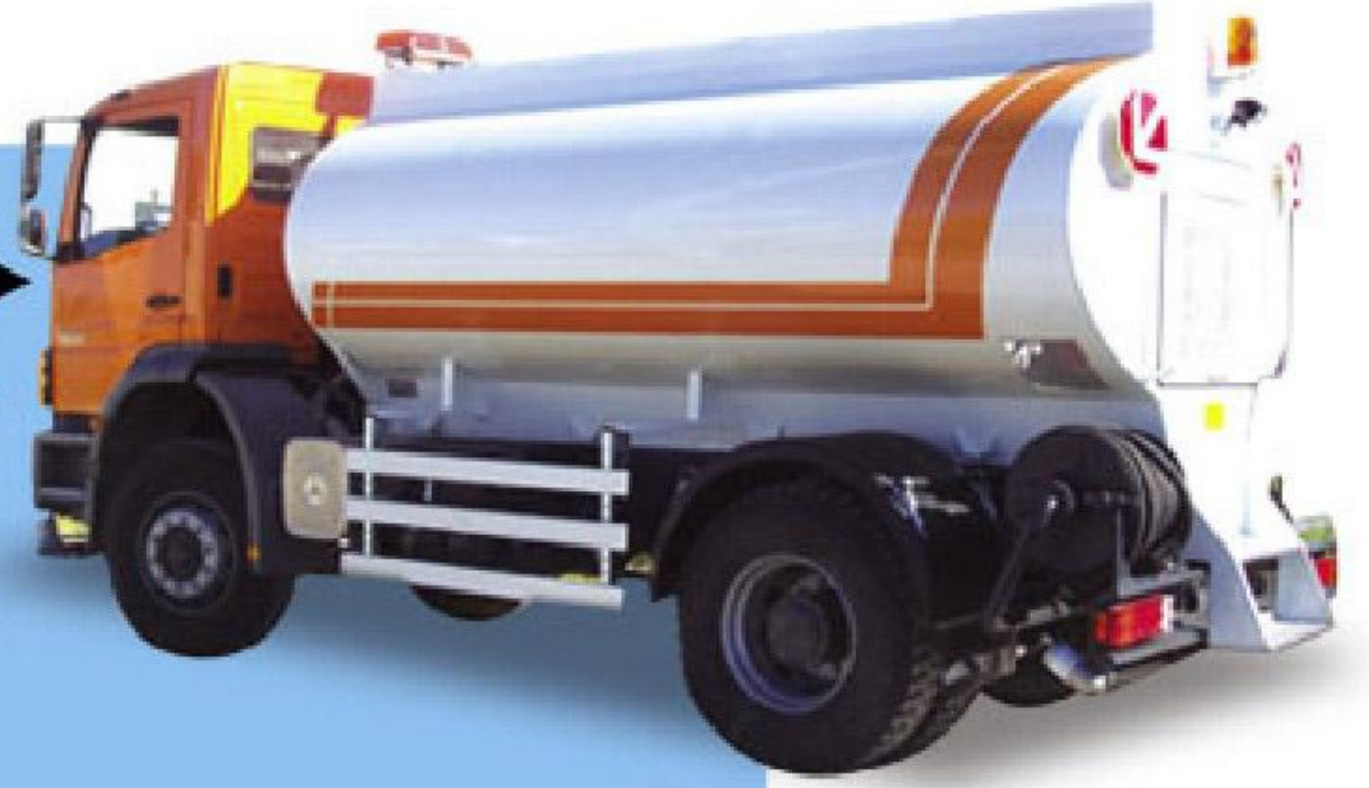
10 TONLUK SULAMA ARAZÖZÜ

6 tondan 20 tona kadar rediktörlü tip su pompalı elips tipi kazan iki adet yangın çıkışı pnomatik ön sulama sistemli hidrolik veya mekanik çıkık sistemli enjektör emişli sulama arazözü.