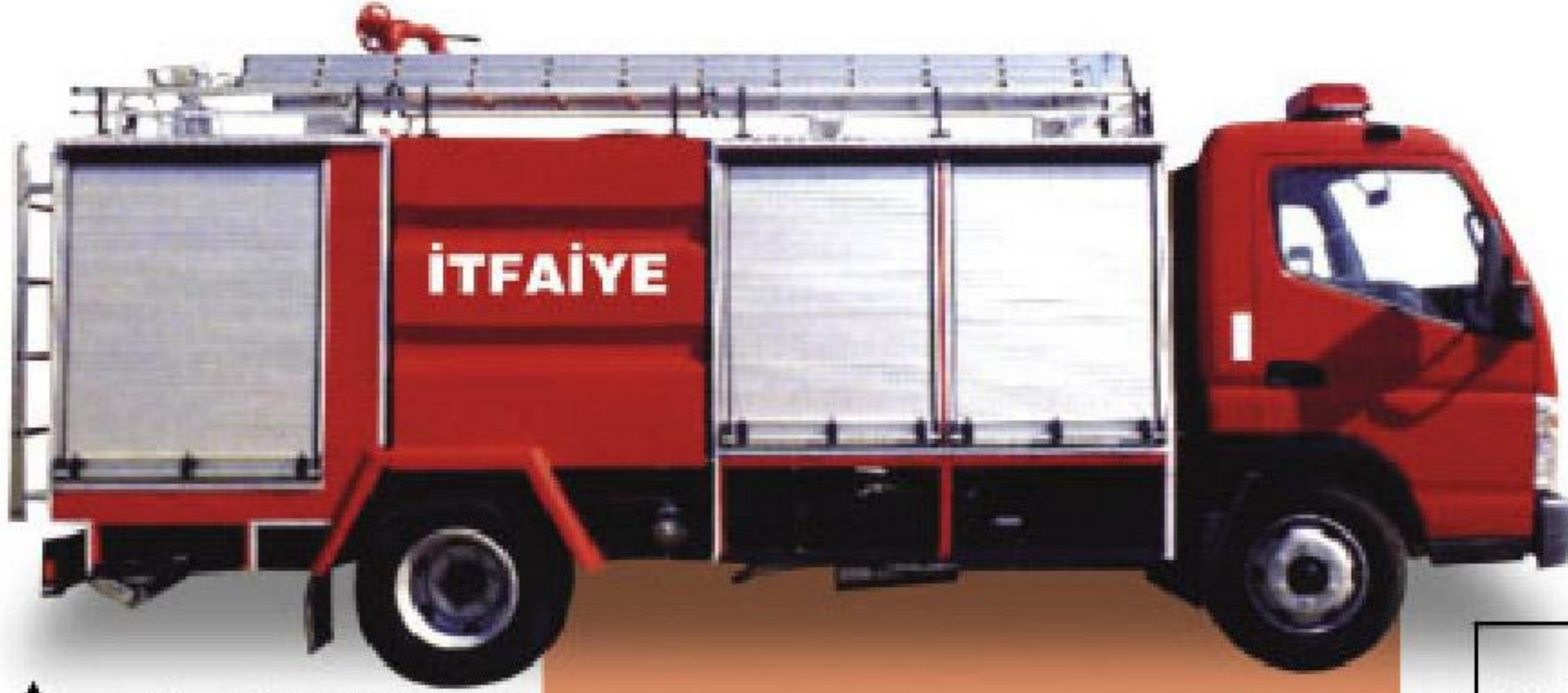
ACİL MÜDAHALE ARACI

Kurtarma araçları itfaiyelerimizde öncü araç olarak kullanılabilen ve gerek su tanklı, gerekse yalnızca kurtarma ekipmanları ve yedek malzemeleri taşıyıcı ekipman olarak imal edilmektedir. İç dizayn müşterinin isteğine göre düzenlenmektedir. Araçlarda kullanılan karasör panjurları alüminyum tamburlu tip olup kabin üzeri eskort anons sistemli tepe lambası ile donatılmıştır. Ekipmanlarımız modüler sistem olarak üretilmektedir.