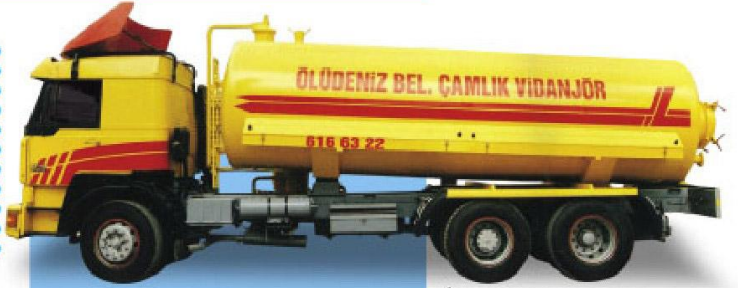
15 TON KAPASİTELİ VIDANJÖR ARAÇLARI

6 tondan 15 tona kadar vakum sistemli otomatik emniyet supaplı kendinden otomatik yağlamalı vidanjör araçları, kullanılmış veya yeni istenilen araç üzerlerine monte edilmektedir.