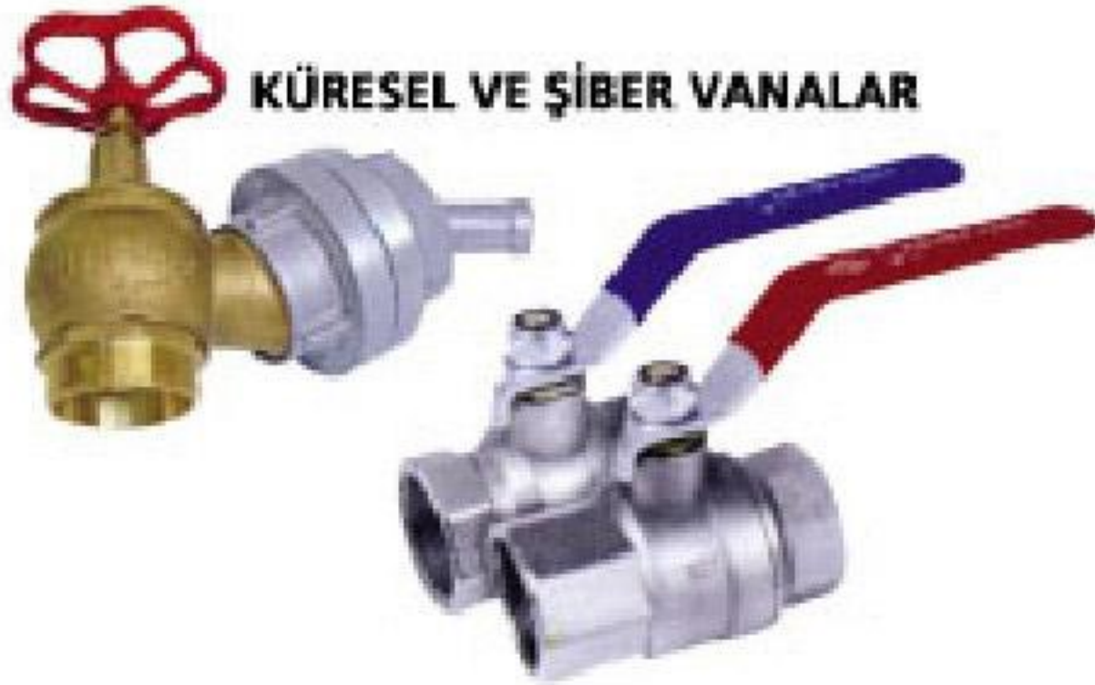
KÜRESEL VE ŞİBER VANALAR