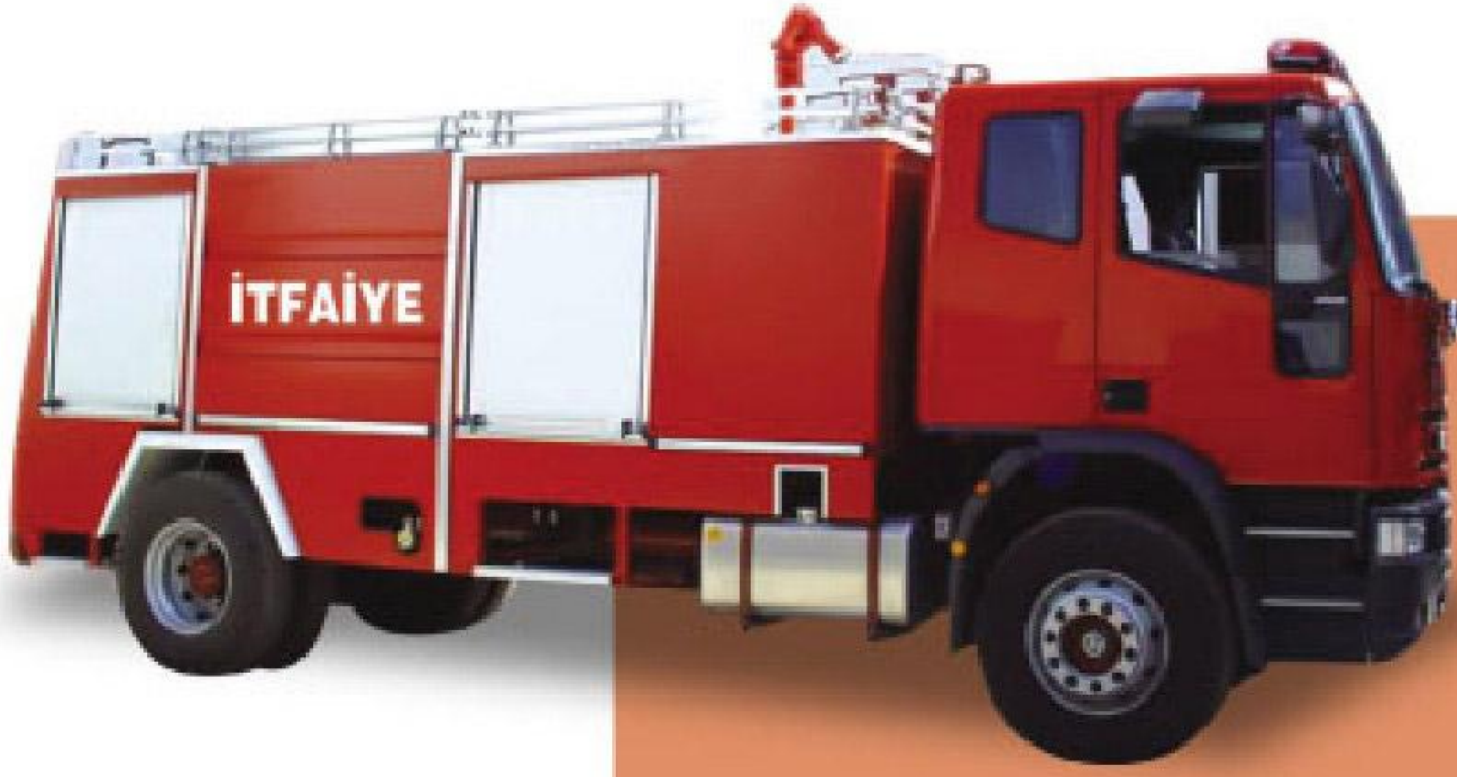
6 TON KAPASİTELİ PORTATİF MERDİVENLİ İTFAİYE ARACI

9 metre portatif alüminyum merdivenli 6 tondan 10 tona kadar su tankı 200 lt'den, 500 lt'ye kadar köpük tankı kapasiteli rediktörlü tip santrafuj pompalı, 4 adet yangın çıkışı, 1 adet monitör, pnomatik ön sulama sistemleri modüler tip karasör ve karasöre bağlı olarak alüminyum panjurlu tam teşekküllü standart tip itfaiye araçları.