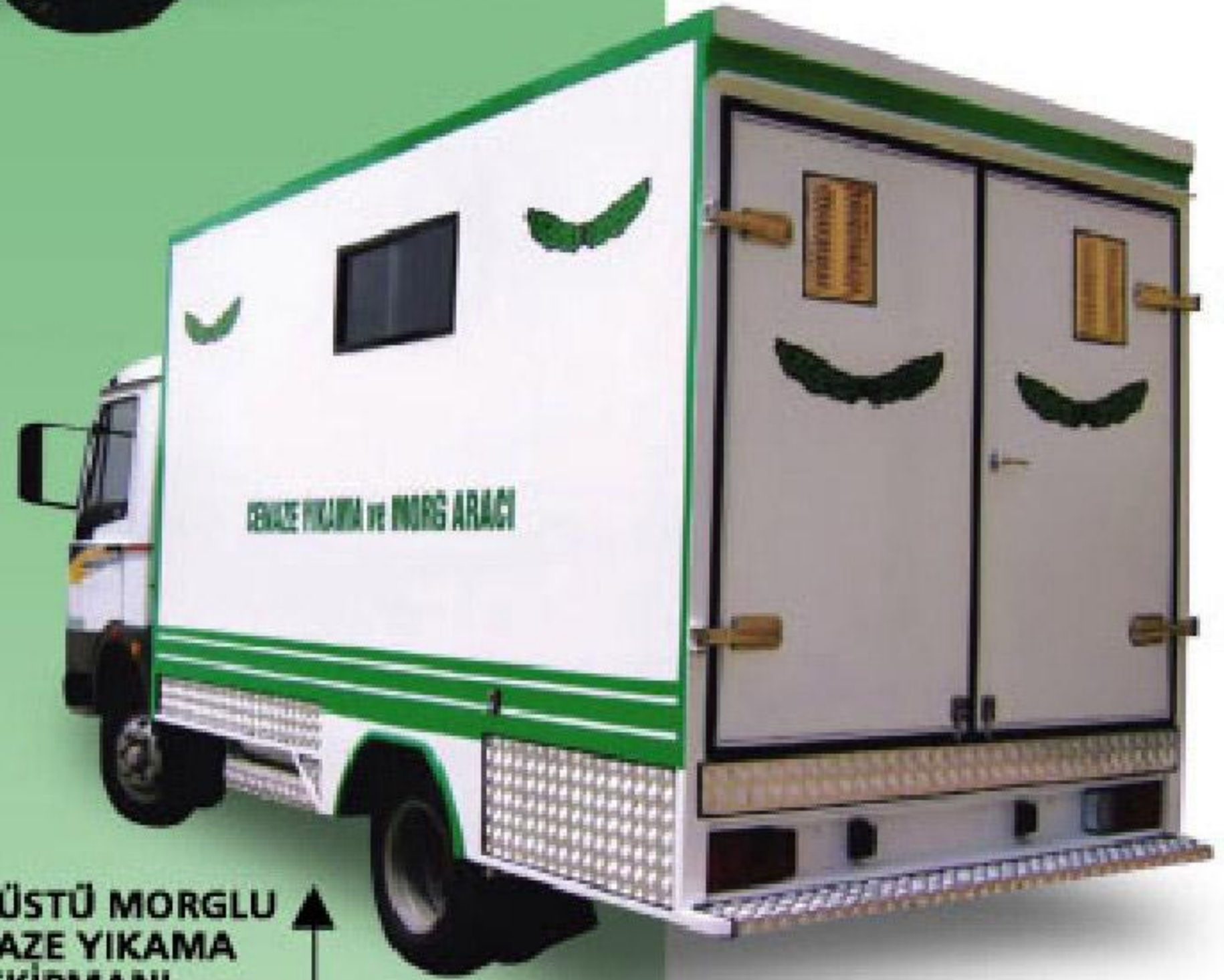
ARAÇ ÜSTÜ MORGLU CENAZE YIKAMA EKİPMANI

Cenaze araçları ebatlarının boyu 4.10, eni 2.10, yüksekliği 2 metre olarak üretilmektedir. İsteğe bağlı farklı ebatlarda imalat yapılması mümkündür. Bu ekipmanlarda temiz ve atık su tankları mevcut olup havalandırma sistemi, portatif kefenleme ve malzeme dolabı, lavabo, elektrik sistemi monte edilmektedir.