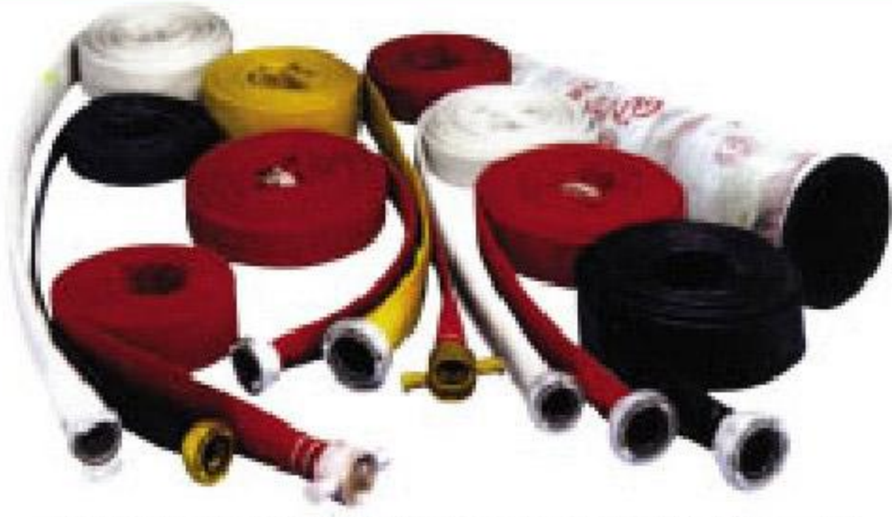
YANGIN VE EMİŞ HORTUMLARI 2",2.5" ve 4"