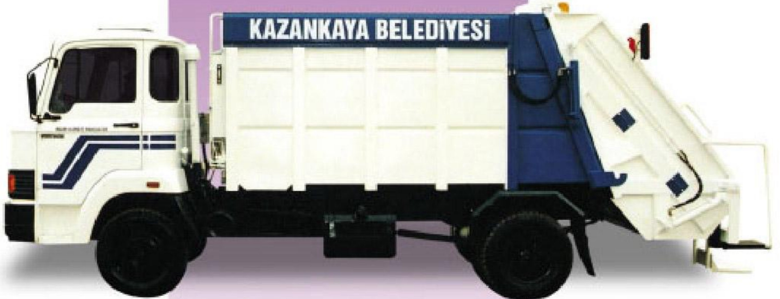
7+1M 3 KAPASİTELİ ÇÖP EKİPMANI