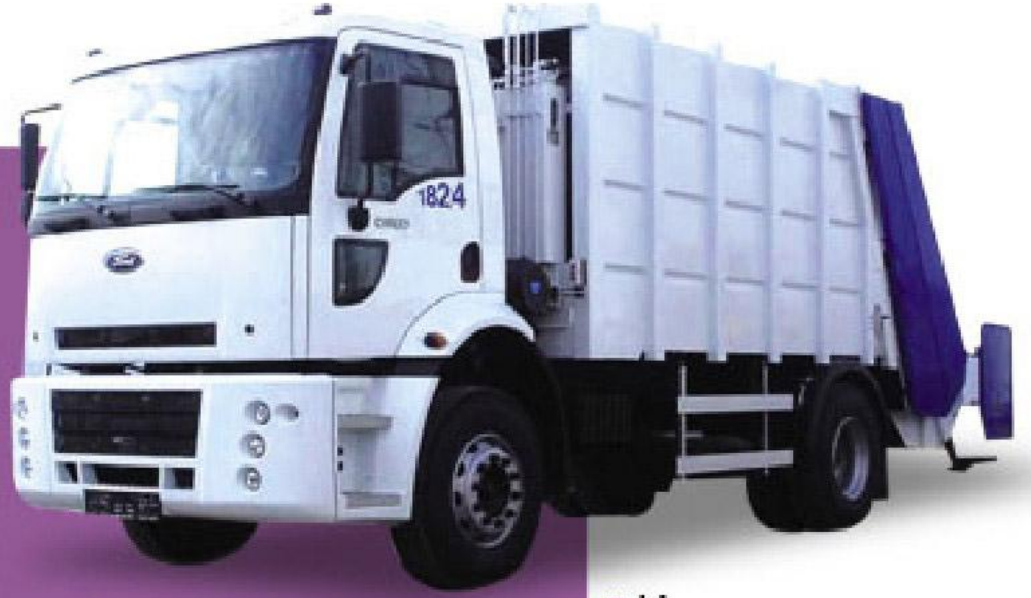
15+1.5M 3 KAPASİTELİ ÇÖP EKİPMANI

Çevre temizliğinde imalatını yapmış olduğumuz hidrolik sıkıştırımlı çöp toplama ekipmanları Belediyemize büyük kolaylıklar sağlamaktadır. Bu ekipmanlarda isteğe bağlı 200 - 400 - 800 lt kapasiteli çöp kovalarına göre kaldırma düzeni uygulanmaktadır.