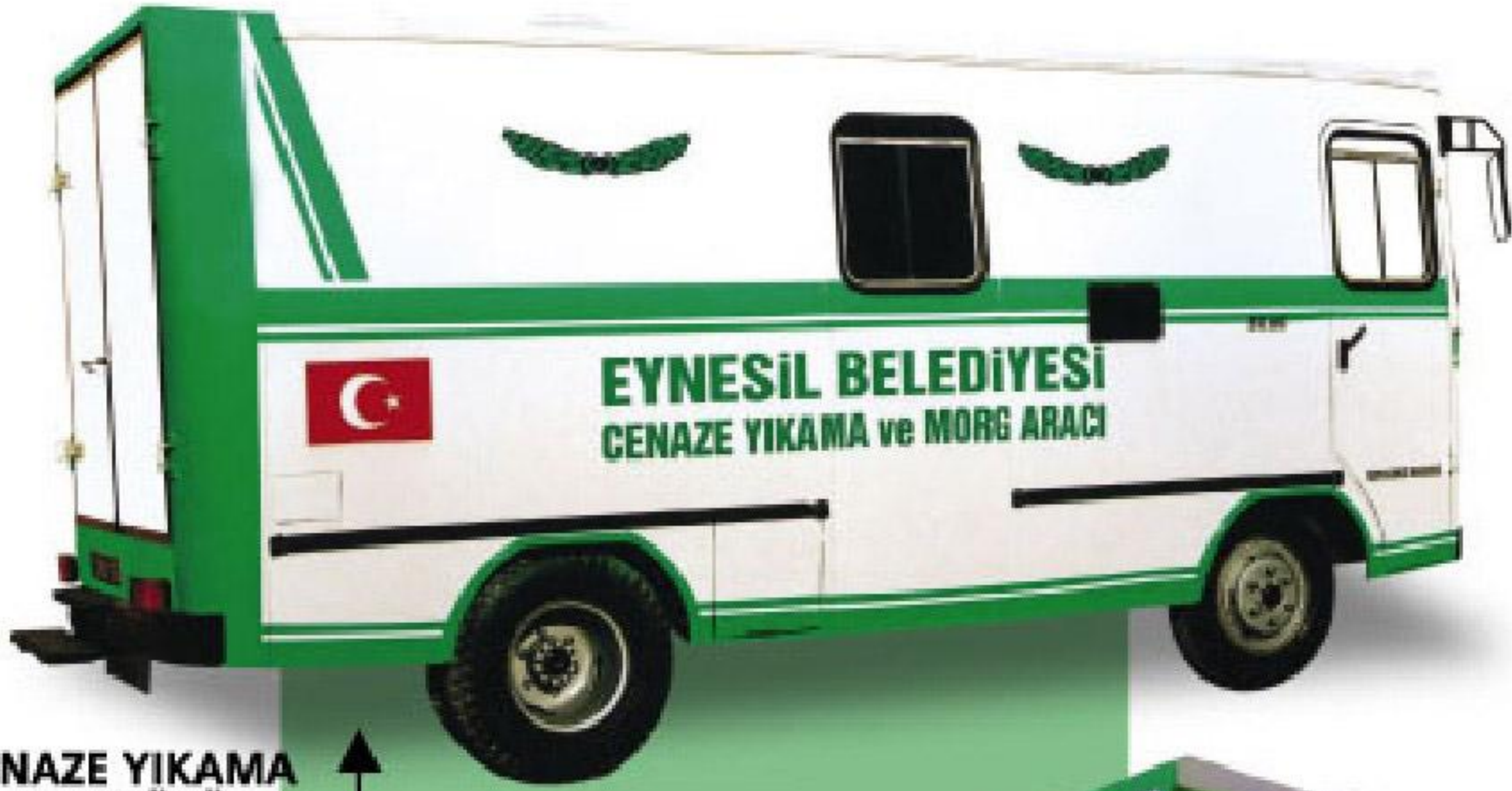
CENAZE YIKAMA OTOBÜSÜ