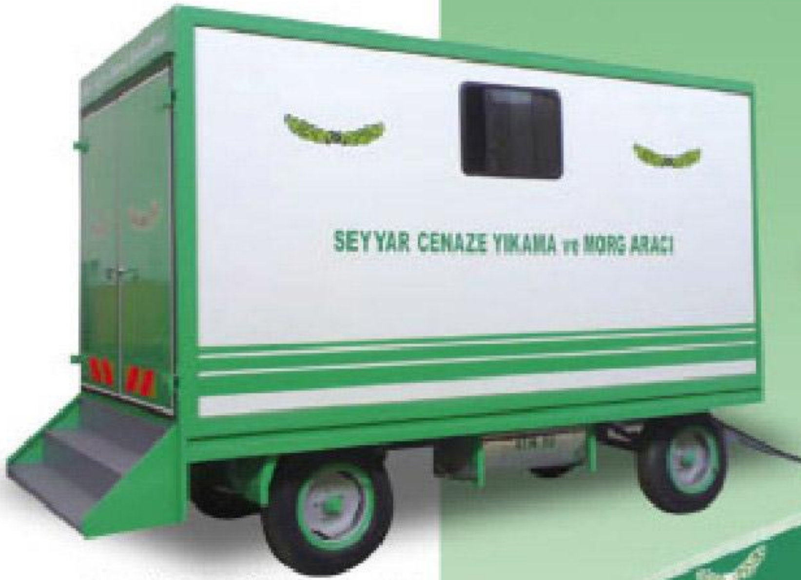
ÇİFT DİNGİL RÖMORG ÜZERİNE MONTE EDİLMİŞ CENAZE YIKAMA ARACI