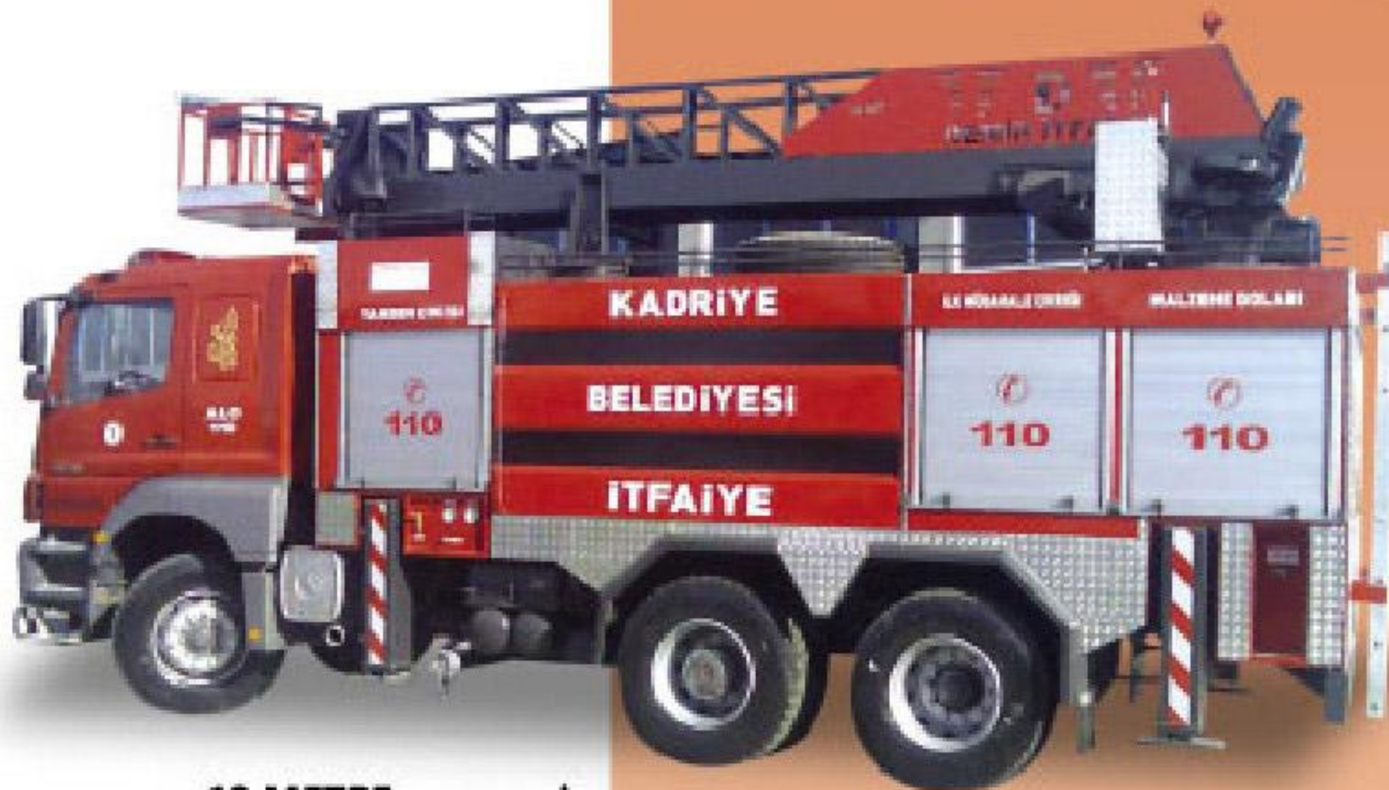
18 METRE HİDROLİK MERDİVENLİ İTFAİYE ARACI