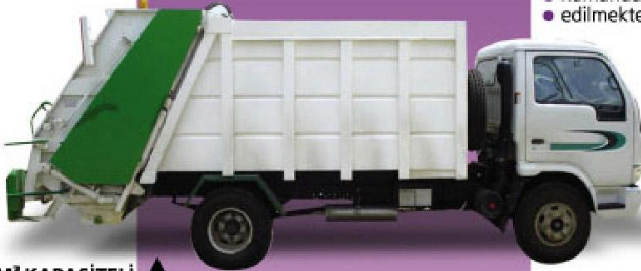
6+1M 3 KAPASİTELİ ÇÖP EKİPMANI