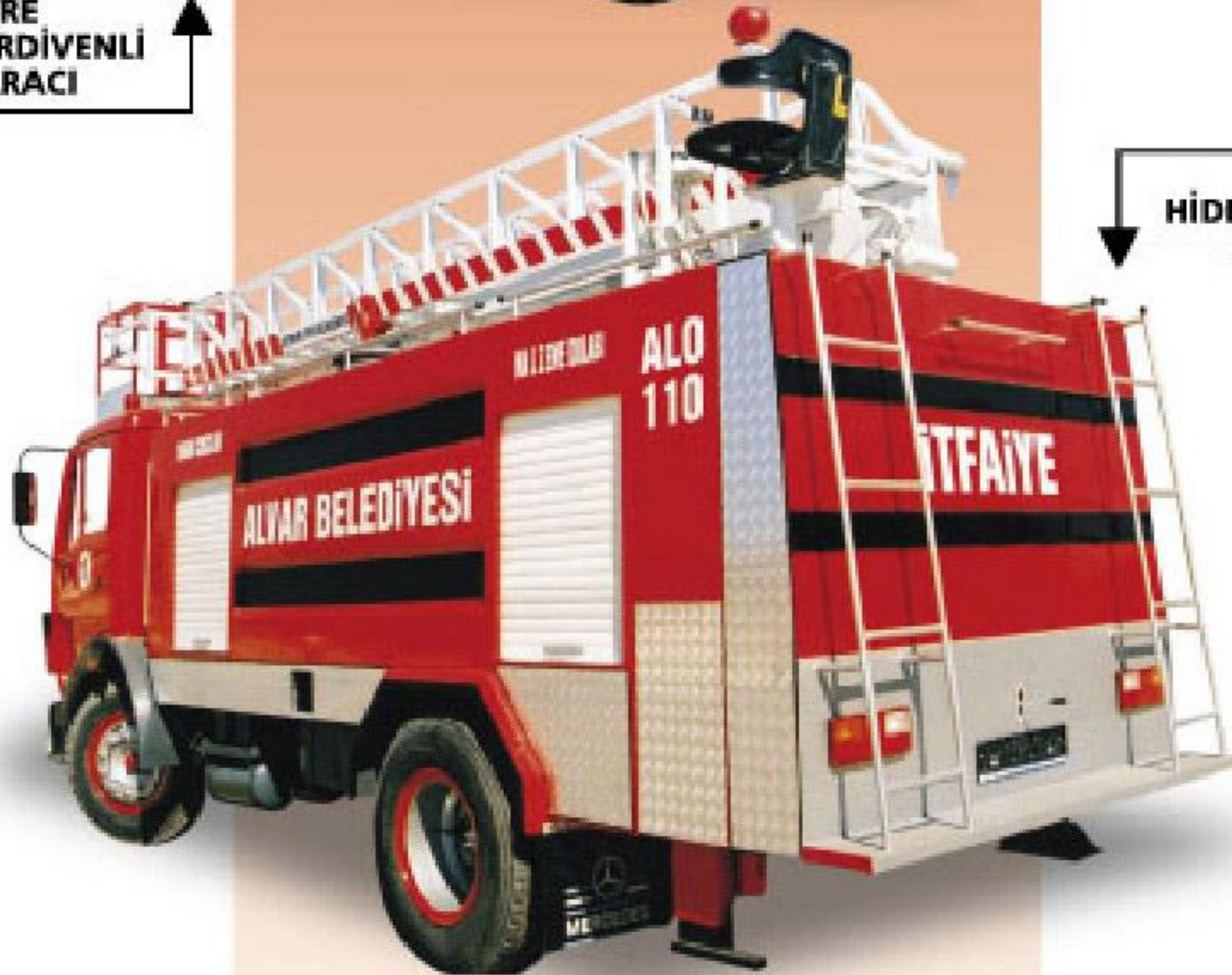
12 METRE HİDROLİK MERDİVENLİ İTFAİYE ARACI