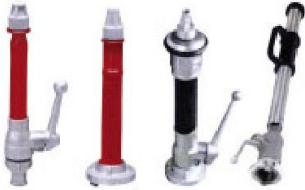
LANSLAR VE KÖPÜK LANSLARI 2",2.5"