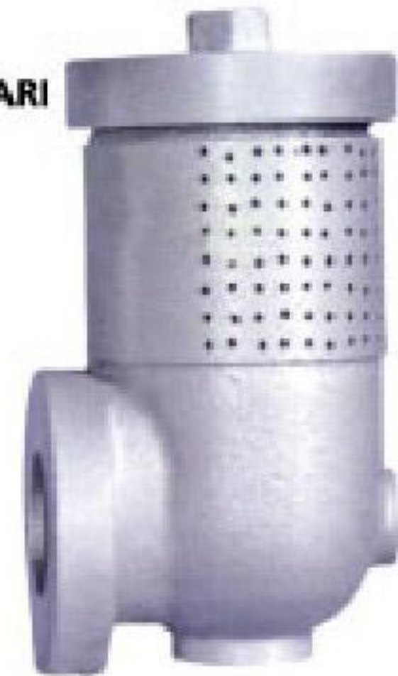
YOL SULAMA BAŞLIKLARI