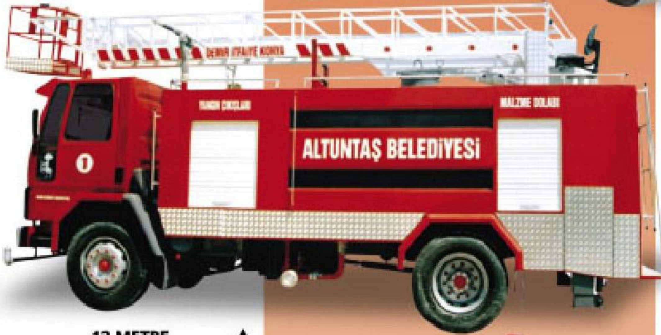
12 METRE HİDROLİK MERDİVENLİ İTFAİYE ARACI