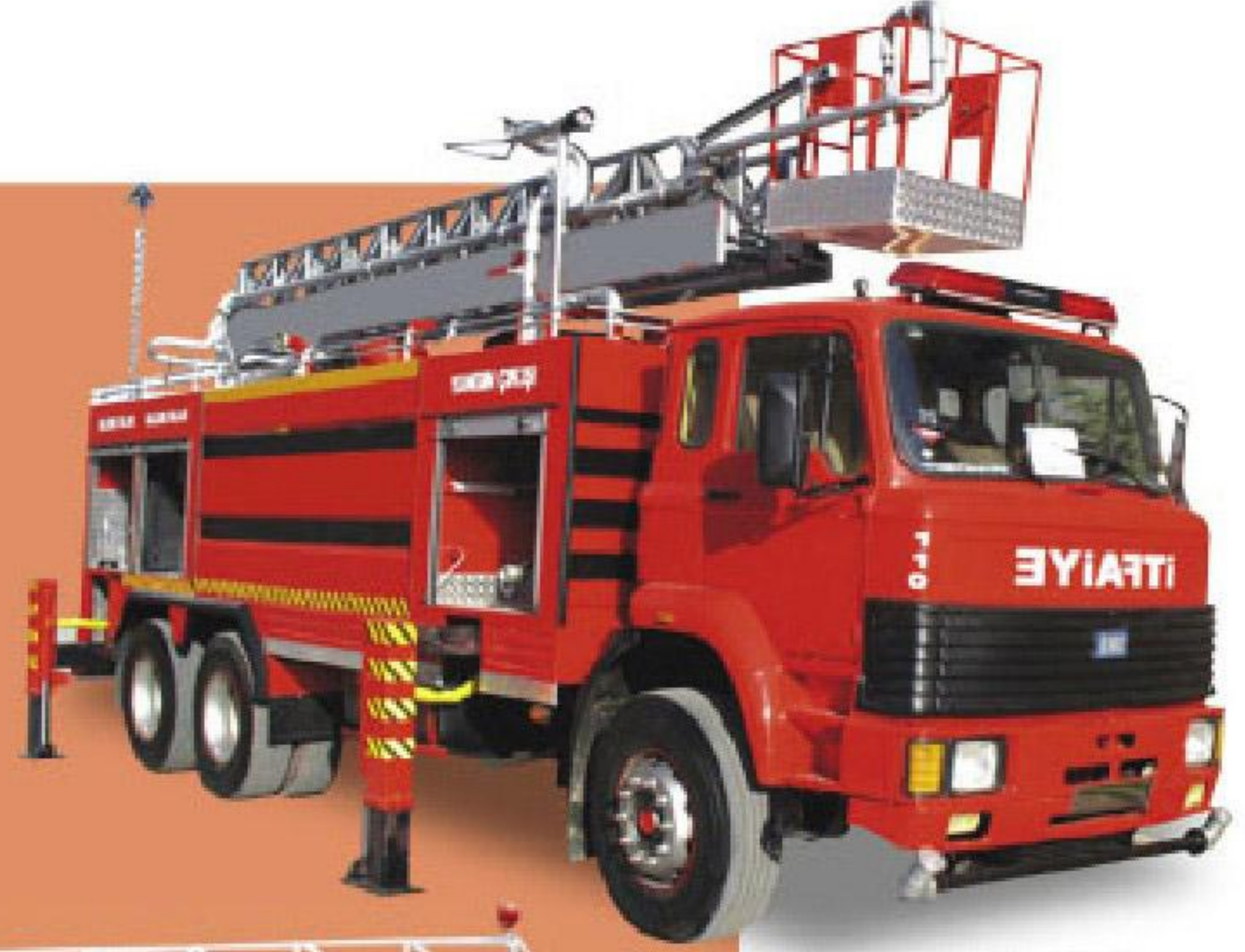
21 METRE HİDROLİK MERDİVENLİ İTFAİYE ARACI

İtfaie pompaları isteğe bağlı rediktörlü tip iki kademe veya yüksek basınç pompalarıyla pto yavru şanzumandan tahrikli tesisata bağlı olarak 2.5 inç 110'luk yangın çıkışları sulama sistemleri uzaktan yangına müdahale için monitörler ve ayrıca isteğe bağlı hidrolik veya mekanik çıkık sistemleri.