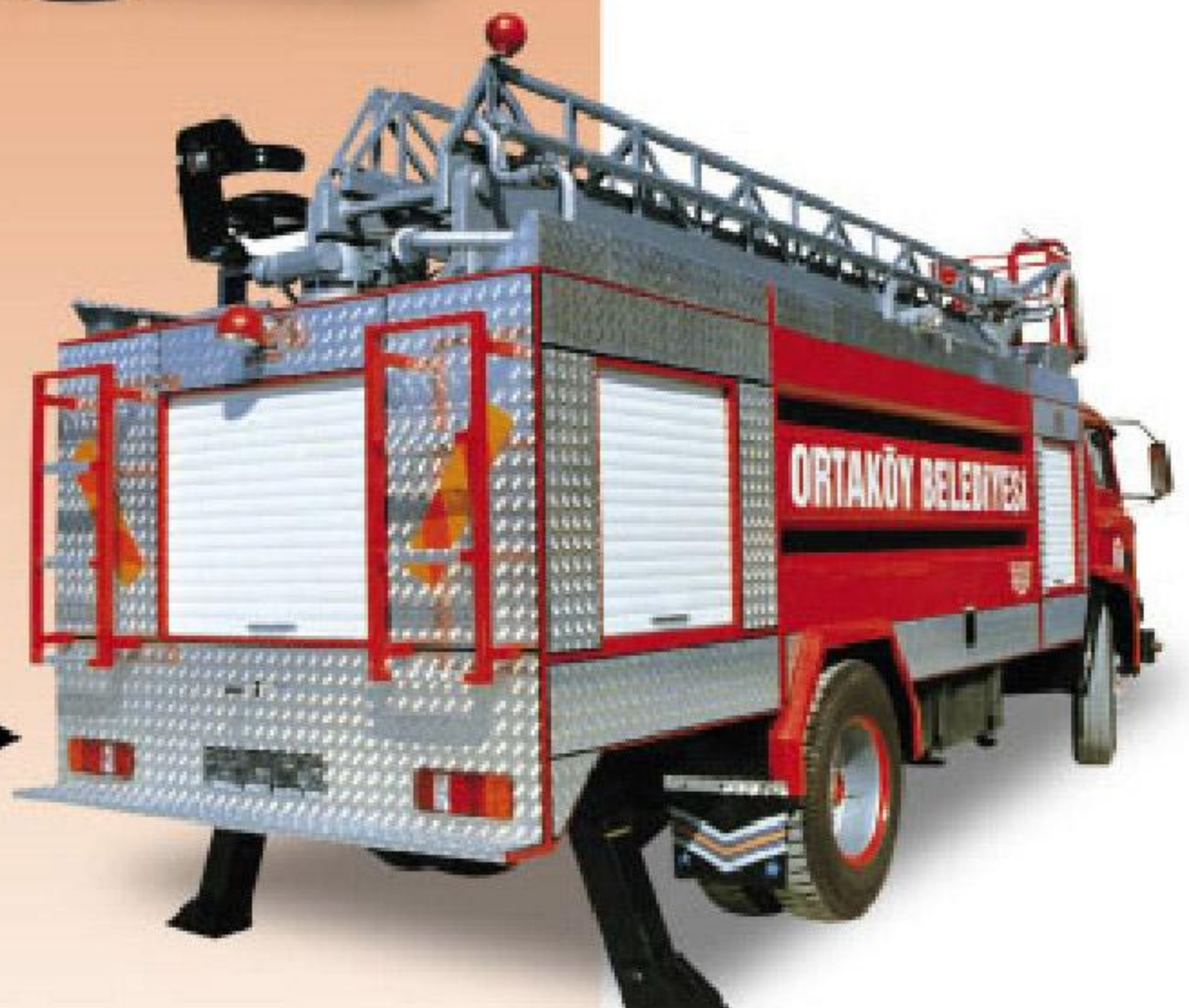
12 METRE HİDROLİK MERDİVENLİ İTFAİYE ARACI